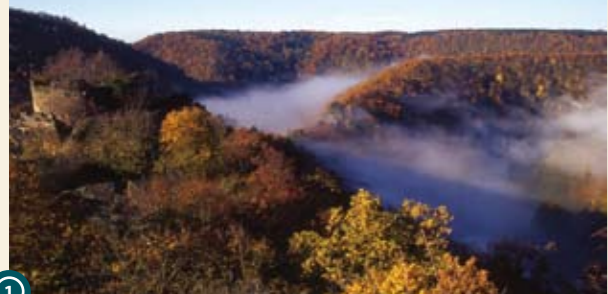
1 „Hranice obou zemí nejsou rozděleny lesem, nýbrž říčka jménem Dyje, tekoucí rovinami, sotva je rozděluje.“ Kosmas Kronika česká L. P. 1082

Čarokrásná dramatická krajina středního Podyjí dává obzvláště vyniknout četným památkám hradní architektury. K pochopení jejich vzniku a úlohy se musíme ohlédnout do historie.