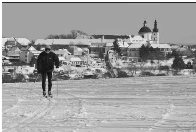
Bílá stopa nad Hradištěm