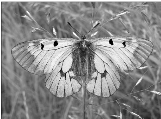
Kriticky ohrožený jasoň dymnivkový žije v Podyjí v jedné z nejbohatších populací ČR