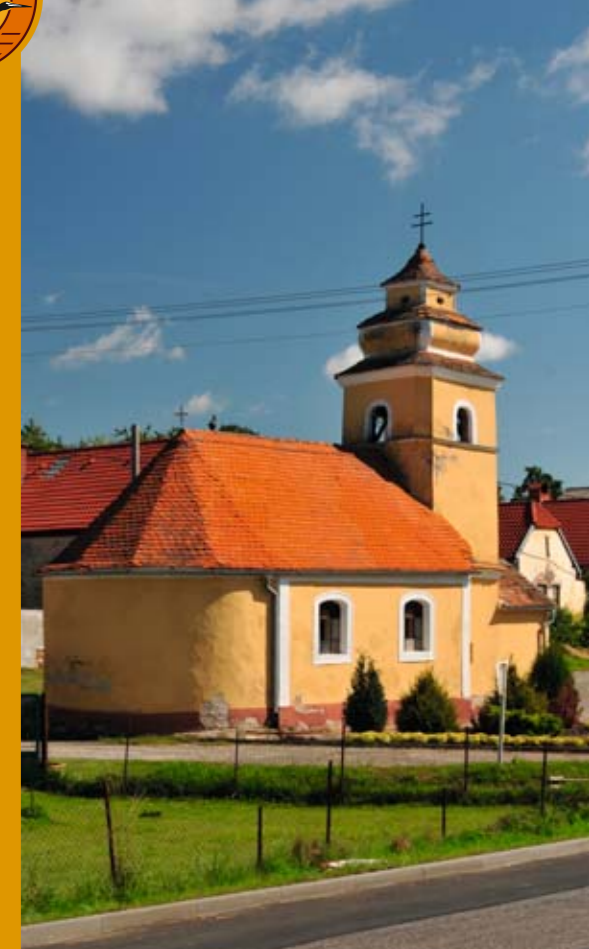
Kaple sv. Markéty v centru obce Podmyče