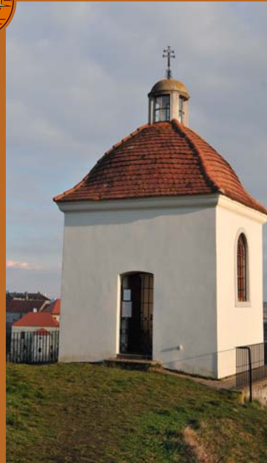
Kaple sv. Eliáše stojí na výšině nad soutokem Dyje a Gránického potoka